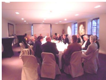
Vue générale de l'Assemblée Générale